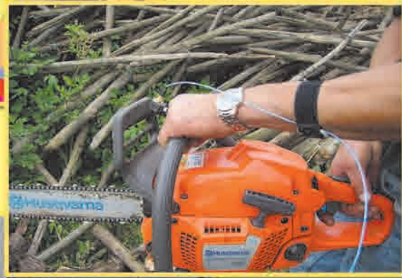
Vibrazioni mano - braccio